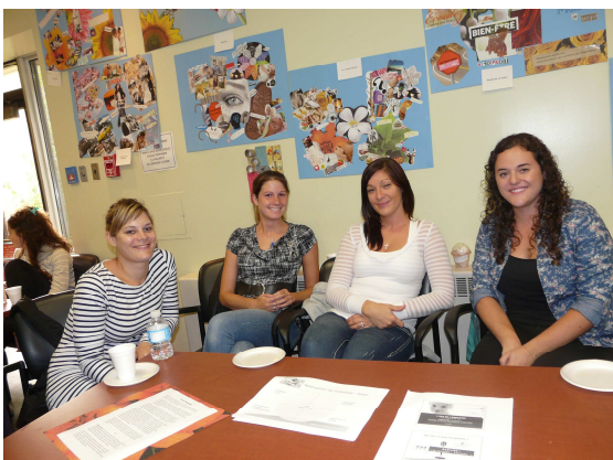
Quelques externes du projet « L'art de l'empathie ».

Dans le cadre du projet de « L'art de l'empathie », les externes ont expérimenté l'écoute empathique accompagnées par des conseillères en soins infirmiers.