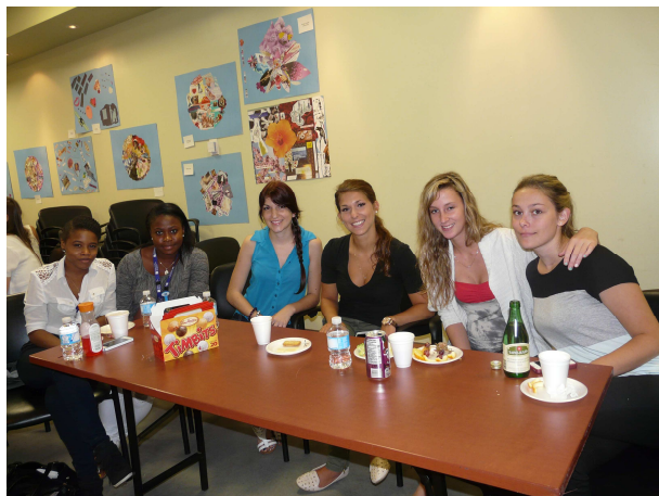
D'autres externes présentent leurs projets aux différents visiteurs.